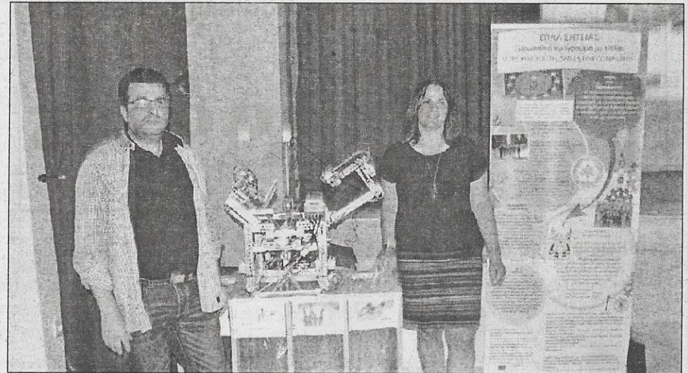
Λεζάντα: Ρομπότ διαλογής απορριμμάτων από το 1ο ΕΠΑΛ Σητείας

Ο Περιφερειακός Διευθυντής Εκπαίδευσης Κρήτης Γεώργιος Τερζάκης και οι Προωθητές των Ευρωπαϊκών Προγραμμάτων Πρωτοβάθμιας και Δευτεροβάθμιας Τζένη Ψαλτάκη και Βασίλης Μανασάκης αντίστοιχα διοργάνωσαν το 3ο Ευρωπαϊκό Φεστιβάλ Δημιουργικής Έκφρασης στα Χανιά και στο Ηράκλειο στο πλαίσιο εορτασμού της Ημέρας της Ευρώπης και της προώθησης καινοτόμων δράσεων και της διάχυσης των Ευρωπαϊκών Προγραμμάτων Δια Βίου Μάθησης, Teachers 4 Europe & Erasmus+.